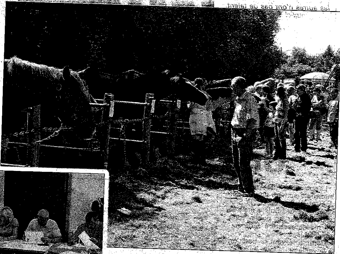
Les chevaux étaient à l'honneur

Les élus n'ont pas manqué le rendez-vous à l'occasion de l'inauguration officielle et du défilé à travers le vil-